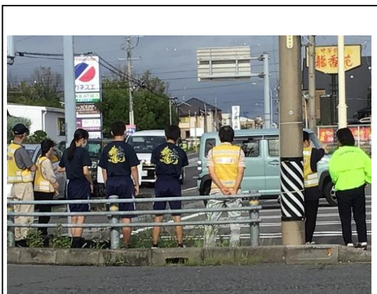
地域の大人と中学生があいさつ活動

現在、週1回のあいさつ活動を子どもたちと地域の大人が一緒に行っている。地域全体にあいさつの輪が広がり、あたたかい地域づくりにつながっていくことを願っている。