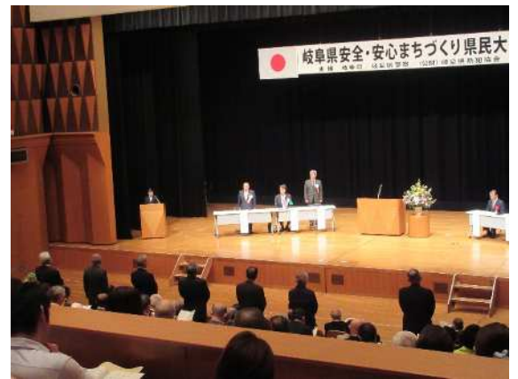
(安全・安心まちづくり賞を受賞した皆さん)