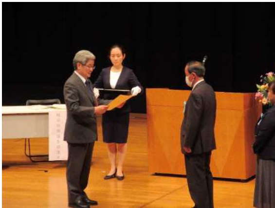
(環境生活部長より表彰状を授与)