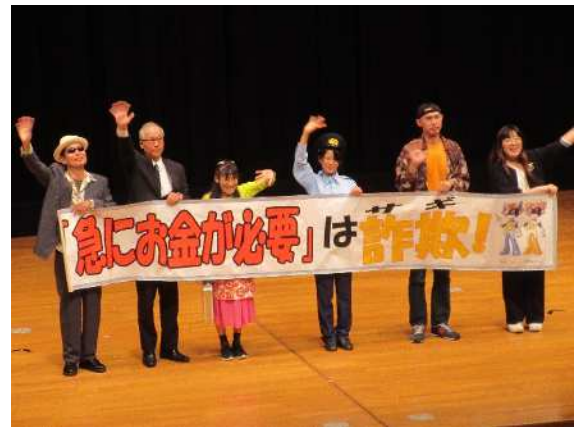
(劇団シンデレラによる防犯演劇)

当日はコミカルな演技で会場を巻き込みながら、楽しく、かつ、わかりやすく、オレオレ詐欺へ誘導する手口とその対処法を学びました。