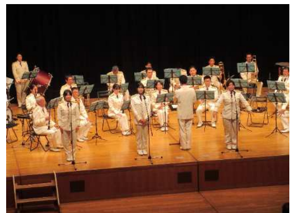
(県警音楽隊による演奏)

当日は、自転車ヘルメット着用を推進するため、県警によるカリメロヘルメットプロジェクトで作られた「ヘルメットの歌」などの演奏を行い、会場を大いに盛り上げました。