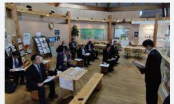
道の駅天童温泉を視察