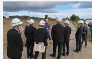
那珂川の改修工事を視察