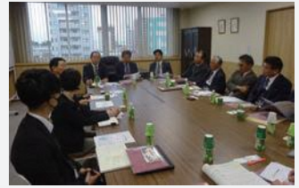
(株)ニトリパブリックを視察