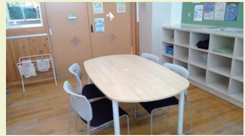
校内教育支援センターの様子

さらに、自宅や別室と教室をオンラインでつなぎ、授業や学級の様子を視聴できるようにするなど、ICTを活用した支援の充実にも取り組んでいきます。