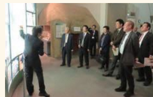
滋賀県立安土城考古博物館を視察

昨年4月から本格稼働を開始した、燃料電池工場で消費する電力を100%再生可能エネルギーで賄う発電プラントや、特別史跡安土城跡など、各史跡を紹介するとともに、その時代の歴史や文化の理解を深めるための博物館を視察しました。