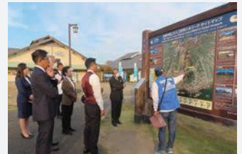
島原半島ユネスコ世界ジオパークを視察