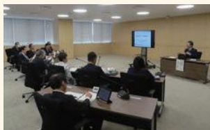
参考人から説明を受ける委員

答弁 地盤の調査やルート選定、場合によっては水利権の調整等が必要となるため、地域ごとによって変わるが、1、2年で完了できるようなものではない。