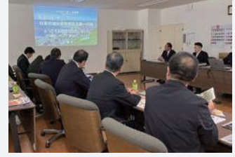
白糠町役場を視察