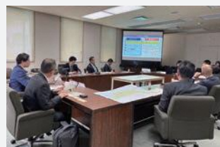
愛媛県教育委員会を視察