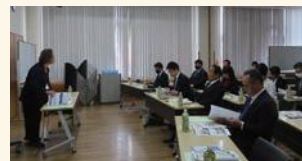
NPO法人可児市国際交流協会を視察

地域住民と外国人居住者が共に安心して暮らせる多文化共生のまちづくりを目指して活動を行うNPO法人可児市国際交流協会を視察しました。