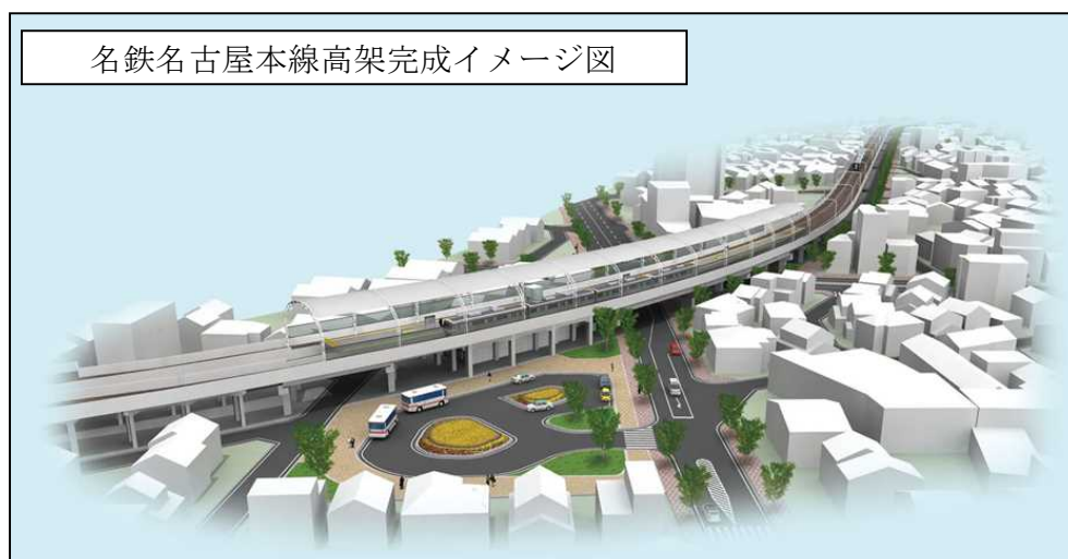
名鉄名古屋本線高架完成イメージ図

(款) 8 土木費 (項) 5 都市計画費 (目) (3) 鉄道高架事業費 (明細書事業名) ○ 公共事業 ○ 単独事業 鉄道高架事業費 鉄道高架事業費