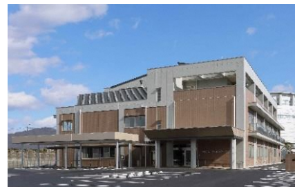
岐阜県立障がい者職業能力開発校

※ 2 第2回入校選考の応募者数が定員を満たした場合は、第3回の募集は行いません。