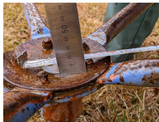
事故の原因となったボルト