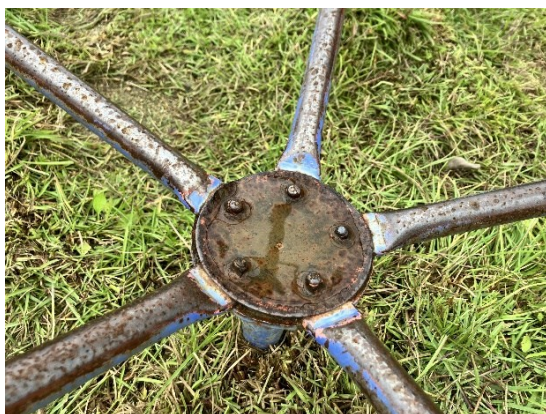
事故の原因となったボルト