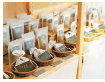
オリジナルの入浴剤を多数販売。浴用化粧品 [YUNIHA] は多彩なハーブを自由にブレンドで きる (20g450円～)

多彩な魅力を楽しんでください。 自然を感じながら、地元食材を使っ たフランス料理や薬膳が味わえる飛 驒のオーベルジュもおすすめ。岐阜の 多様な魅力を楽しんでください。