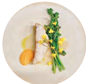
写真はコースの一例。リト リートプランを利用すると、 薬膳料理に