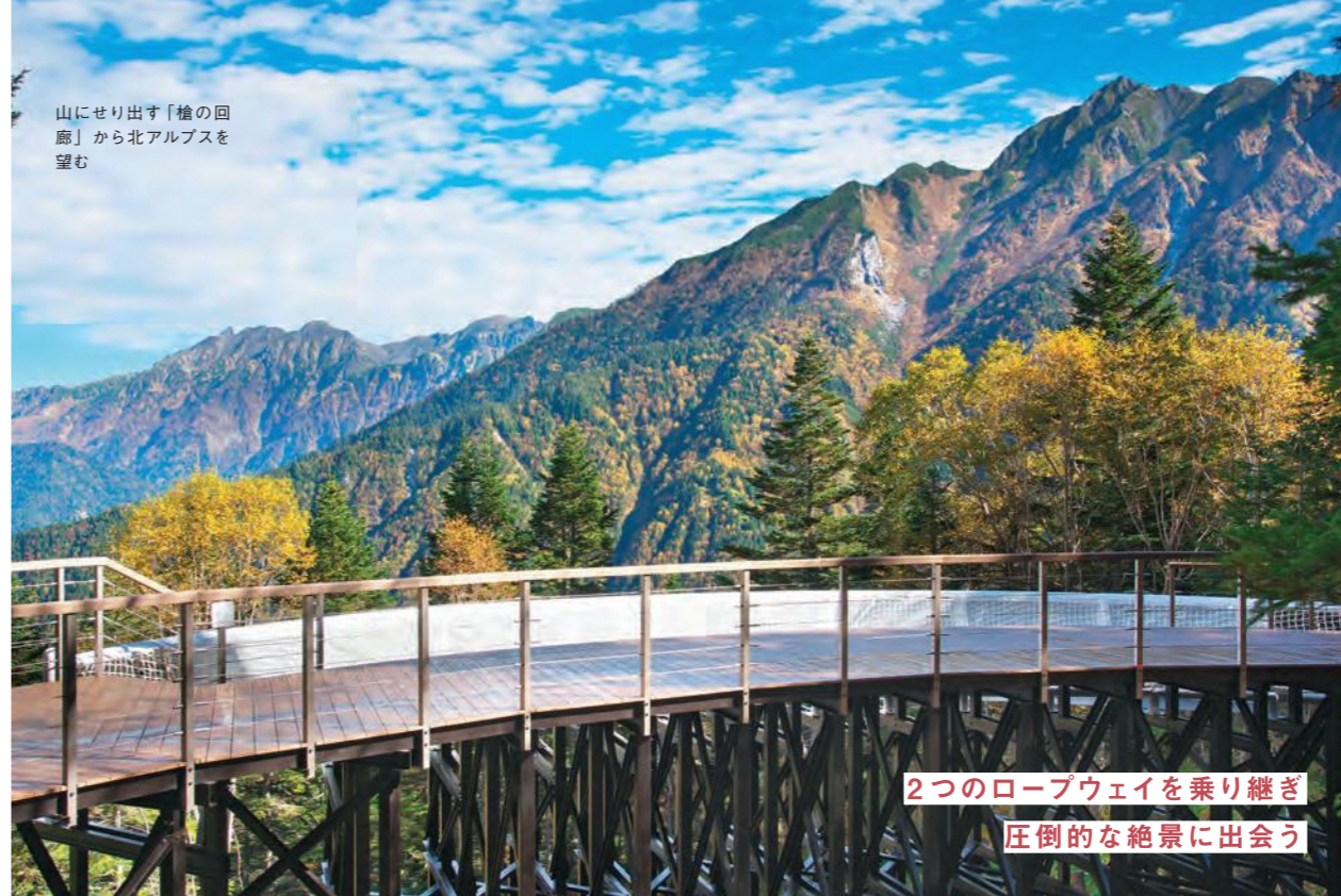
山にせり出す「槍の回廊」から北アルプスを望む

日本三名泉のひとつでもある下呂温泉や奥飛騨温泉郷など、30近い温泉地を有する岐阜県・飛騨地方。冷えた体を芯から温めてくれる温泉は、岐阜の魅力語るうえで外せません。