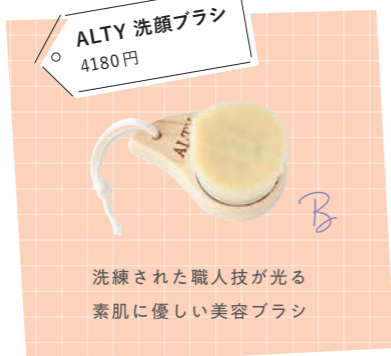
ALTY 洗顔ブラシ 4180円