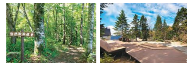
1. 雪に覆われる新穂高の冬 2. 標高2000m級の原生林に囲まれた森のテラス。2024年にはデッキや散策路など新エリアもオープン予定 3. 鍋平高原駅にある自然散策路での森林浴もおすすめ。足湯やビジターセンター、立ち寄り湯などもある