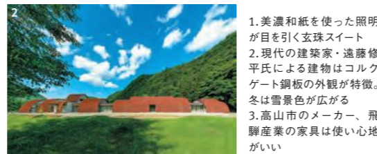
1.美濃和紙を使った照明 が目を引く玄珠スイート 2.現代の建築家・遠藤修 平氏による建物はコルク ケート鋼板の外観が特徴。 冬は雪景色が広がる 3.高山市のメーカー、飛 驒産業の家具は使い心地 がいい