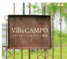
大通りに面したクリニックの奥にあり、 街の喧騒を忘れてゆったりと過ごせ る。全4室、1室3名まで宿泊可能