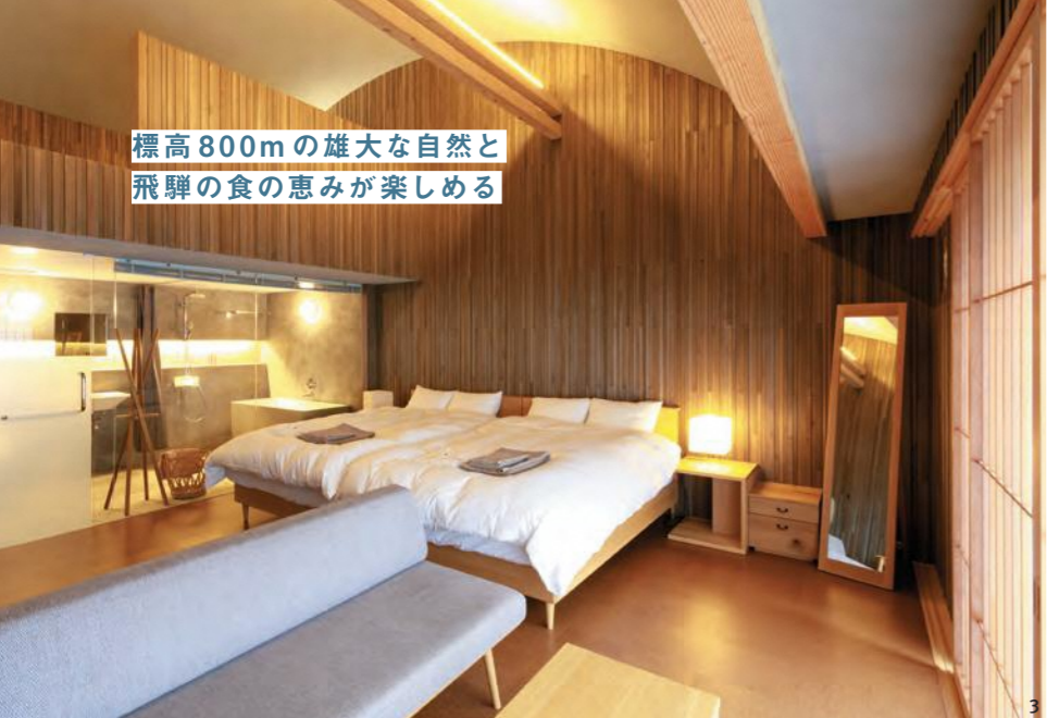
標高800mの雄大な自然と 飛驒の食の恵みが楽しめる