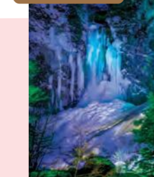
期間中毎日20:00ころから花火が打ち上げられる