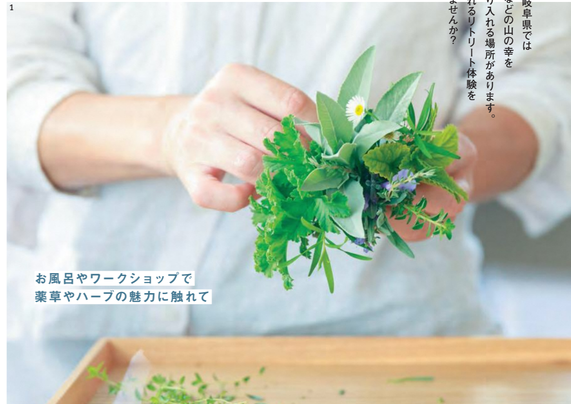
お風呂やワークショップで 薬草やハーブの魅力に触れて

自然農法で育てる薬草ガーデンや菜園を望む ヴィラに滞在し、プライベートな時間が過ごせ るメディカルハーバルリトリート。隣接している 船戸クリニックとの連携により、漢方医の診察 をもとにした、一人ひとりの体に合う食材や調 理法を生かすパーソナル薬膳が味わえる。豊 富な美容セラピーや治療メニューを受けなが ら、3泊4日ほど滞在するのがおすすめ。