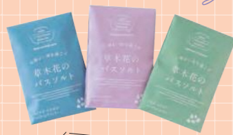
草木花のバスソルト (1包) 627円