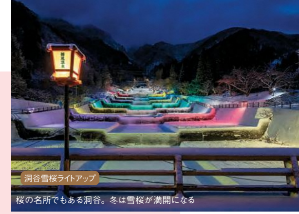
洞谷雪桜ライトアップ 桜の名所でもある洞谷。冬は雪桜が満開になる