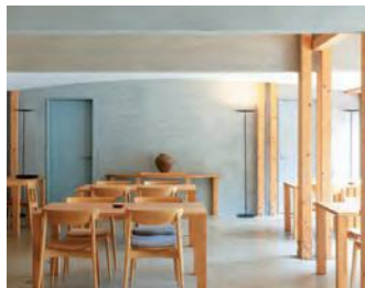
食事が楽しめるダイニング スペース。地元産のアル コールメニューも豊富