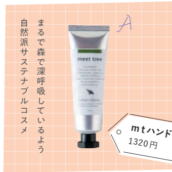
mtハンドクリーム 1320円

旅の思い出は、大切な人へおすそ分け。定番ものから最新のおみやげ、岐阜でしか手に入らないギフトも。今号は乾燥する季節にうってつけ。岐阜らしさをたっぷりの保湿コスメを大特集。