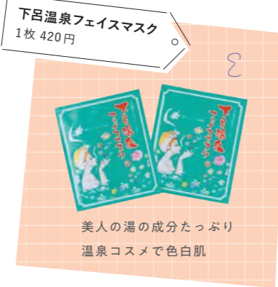
下呂温泉フェイスマスク 1枚 420円