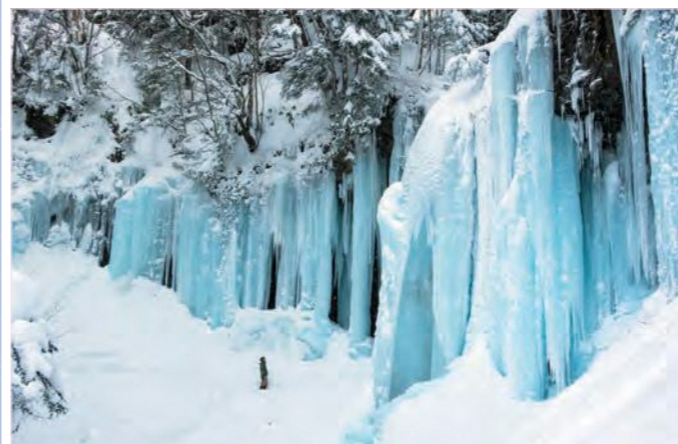
ひと目では見渡せないほどに巨大な氷柱

だより 冬、 雪で真っ白に染まる岐阜の冬。 雪や氷と 長く付き合ってきた地域は、 その楽しみ方も魅力的です。 凛と冷えた空気のなか、 この季節でしか味わえない感動を 体感しに行きませんか。