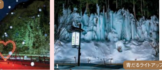
1. 岩から滴り落ちる水が凍り付いて青い水の帯のように見える「青だる」 2. 砂防ダムトンネル内が数万個のLED電球で装飾されたイルミネーションも人気スポットのひとつ

だより 冬、 雪で真っ白に染まる岐阜の冬。 雪や氷と 長く付き合ってきた地域は、 その楽しみ方も魅力的です。 凛と冷えた空気のなか、 この季節でしか味わえない感動を 体感しに行きませんか。