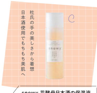
snowy 花酵母日本酒の保湿液 (100ml) 3520円