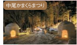
中尾かまくらまつり 白山神社の境内に大小さまざまなかまくらが登場する

0578-89-2614 (奥飛騨温泉郷観光協会) 岐阜県高山市奥飛騨温泉郷平湯ほか JR高山駅からバスで1時間(平湯) https://www.okuhida-fuyumonogatari.com/