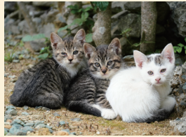
猫は1回の出産で1~8頭ほどの子猫を産み、1年に2~3回の出産が可能です。

とても繁殖力が強く、交尾すると高い確率で妊娠します。餌を与えて栄養状態が良いと、さらに繁殖力が強くなります。