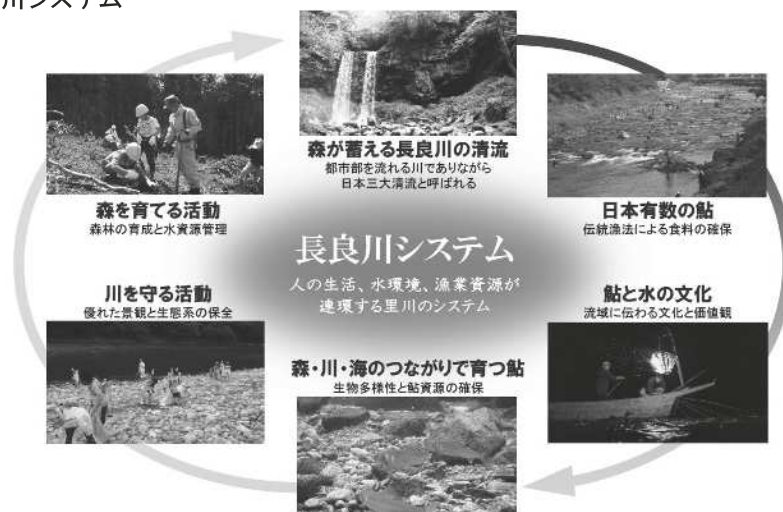
図2-3-2 長良川システム