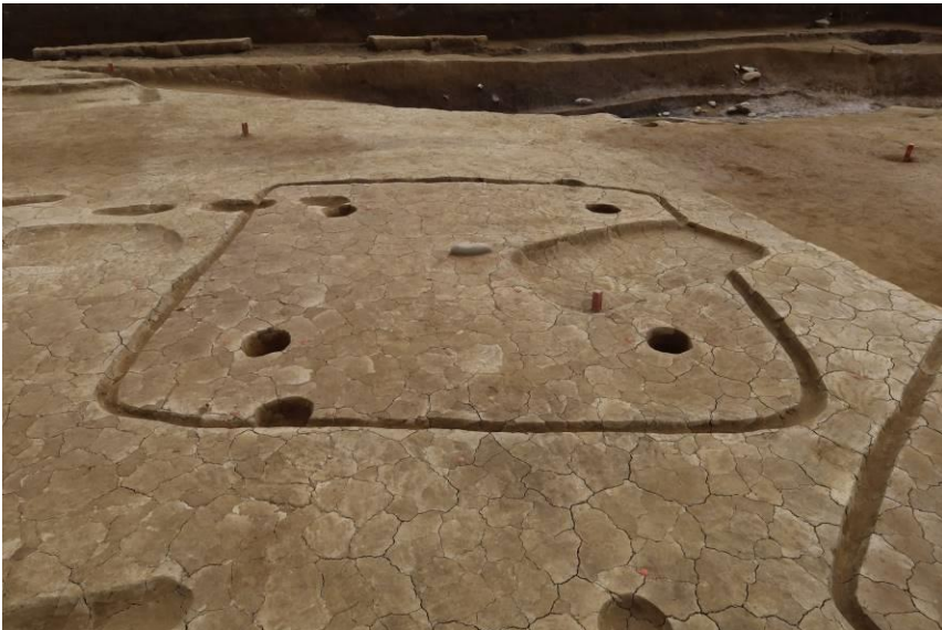
弥生時代後期から古墳時代 初めの竪穴建物