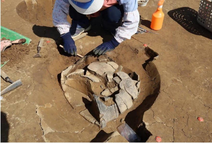
縄文時代の土器棺墓