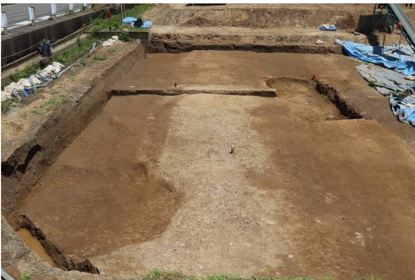
近世の郡上街道跡