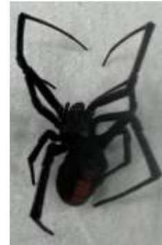
セアカゴケグモ 成体 (胴体9mm)

特定外来生物で、国内では平成7年に大阪府内で初めて発見され、現在では全国各地で広く生息が確認されている。日当たりのよい暖かい場所で、地面や人工物の窪みや穴、裏側、隙間に営巣する。攻撃性は少なく、驚かせたりしない限り人を咬むことはない。 セアカゴケグモのメスは毒をもっています。