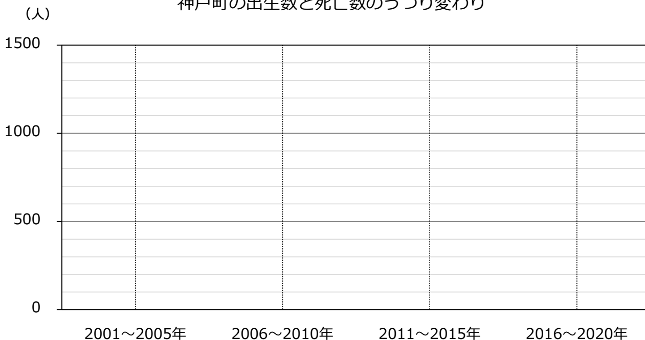
神戸町の出生数と死亡数のうつり変わり