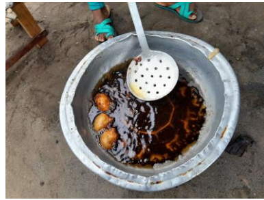
↑「タレタレ」(揚げたバナナ)

→美味しいです！特にパイナップルはとても甘く、芯まで食べることができます。お店にもよりますが、一つ25~75円で買うことができるのでとてもお得！