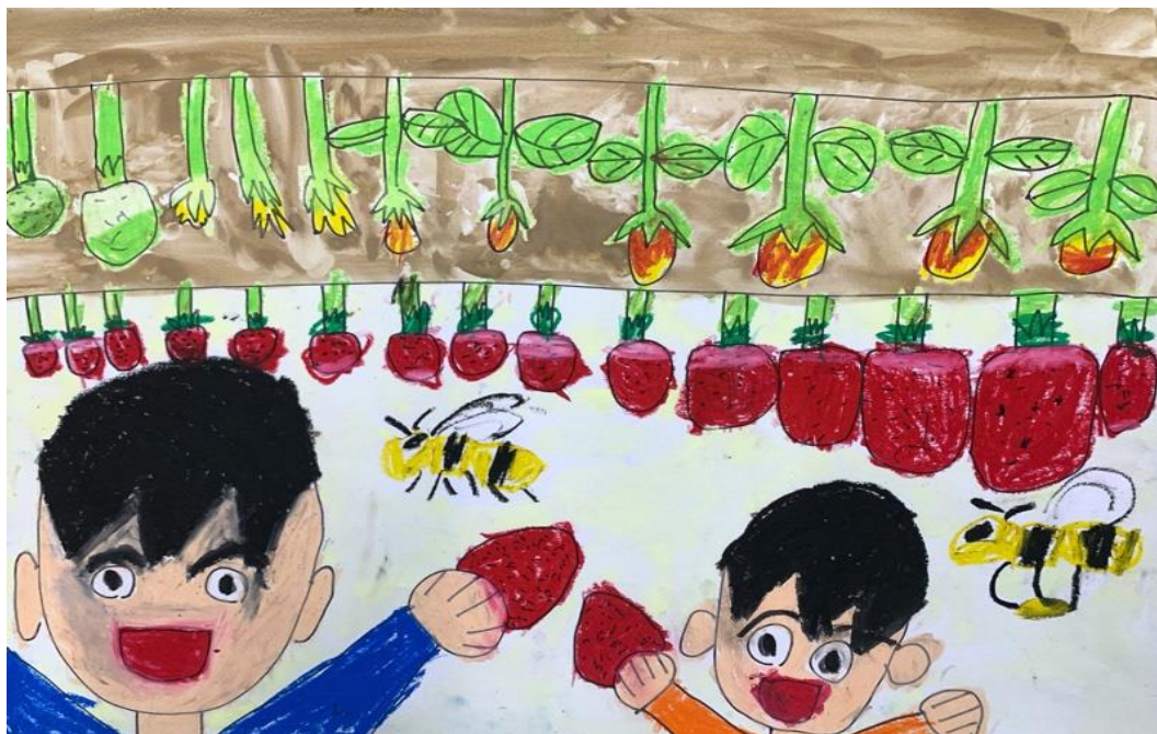
「たくさんたべたぞいちごがり」