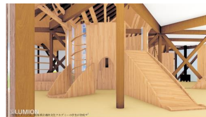
施設内観(パース図)