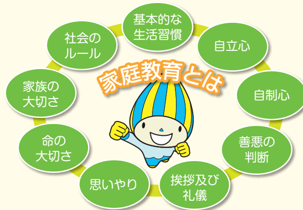
岐阜県家庭教育支援条例より