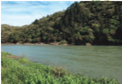
なからがわ いけしりちく 関市・長良川 池尻地区

一見おだやかに見える流れも、川ぞこの影響で流水は一定ではないんだよ。川の事故の約90%はこのおだやかな流れで発生しているよ。近寄る際はライフジャケットを必ず着用しよう！