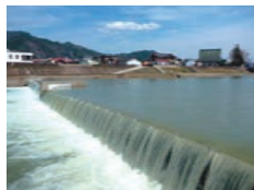
取水堰: 飛騨市・宮川 大古堰 みやがわおおくこせき