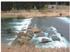
床止工: 高山市・荒城川 あらかがわ