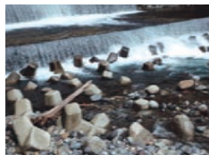
水制: 下呂市・小坂川 あさかがわ

川ぞこを守るために、川ぞこにコンクリートブロックが並べられていることがあるよ。すきまに、はさまれたり、強い流れに引き込まれたりすることがあるのでぜったいに近づかないで！