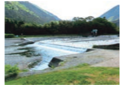
堰堤: 揖斐川町・粕川 かすかわ