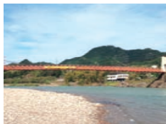
橋: 美濃市・長良川 美濃橋 なからがわ のはし