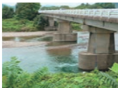
橋: 岐阜市、関市・武儀川 千足橋 むきがわせんじゆはし