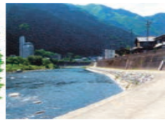
下呂市・飛騨川 ひたがわ

上流にダムのある川では、放流による増水に注意してね。事前に放流情報を確認し、川岸で遊んでいるときは常に放流予告のサイレンに耳を傾けよう。また、急に増水するところではぜったいに子どもだけで遊ばないで！