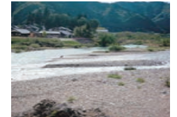
美濃市・板取川 いたどりがわ