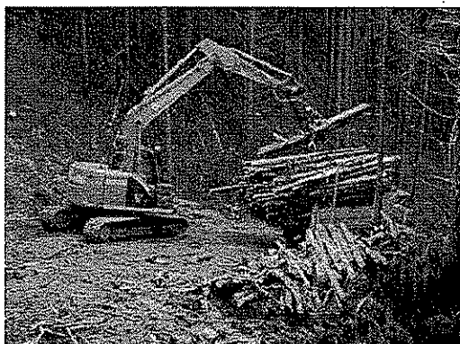
搬出間伐の実施状況