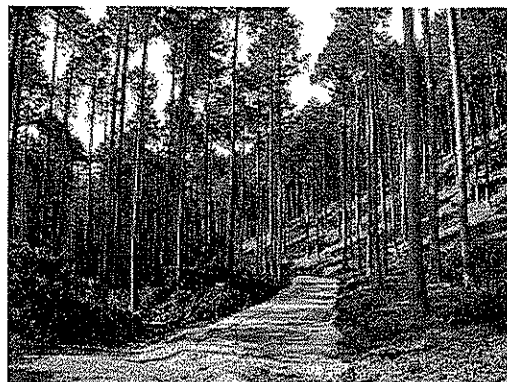
間伐が実施された森林

(款) 6 農林水産業費 (項) 5 林業費 (目) (6) 森林整備費 (明細書事業名) ○ 公共事業 森林整備事業費補助金 他