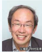
コミュニケーション工学者 東京大学名誉教授 原島 博