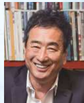
作曲家 三枝 成彰