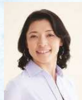
経済評論家 勝間 和代