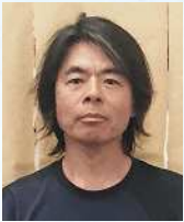
アーティスト 日比野 克彦