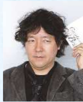
脳科学者 茂木 健一郎