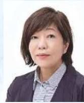
作家 林 真理子