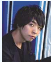
メディアアーティスト 落合 陽一