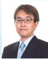
将棋棋士 羽生 善治