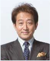
俳優／「日本のワインを 愛する会」会長 辰巳 琢郎