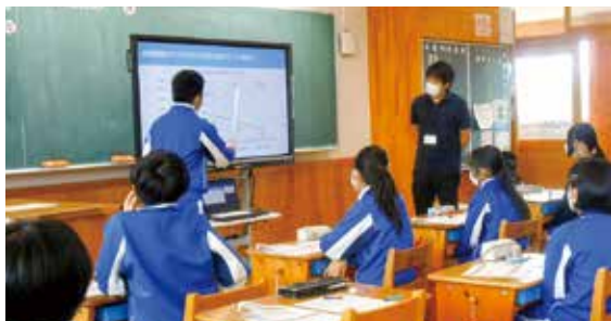
令和4年9月 高山市立東小学校6年生のみなさんと