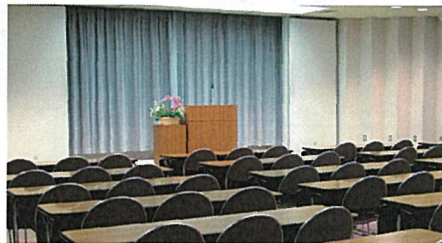
大会議室 ▶ (120人)

会議、研修会、講演会などに利用いただけます。マイク、プロジェクター、DVD、レーザーポインタ等も無料で利用できます。