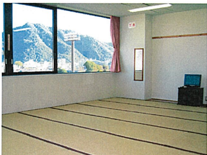
▲和室(7人/11人部屋)32室264名様まで

洋室シングルから和室の11人部屋までビジネスからファミリーまで、幅広く利用いただけます。