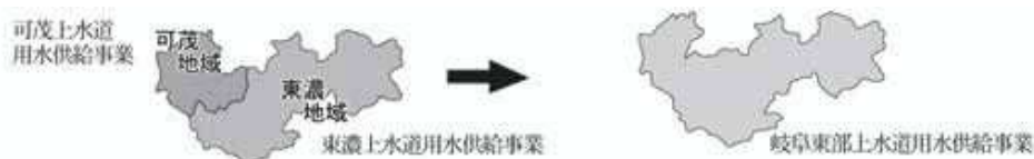
事業統合のイメージ図

なお、給水規模は、創設当時の6市4町の約28万人から、約45年を経過した現在は、7市4町の約50万人の水道水を供給するまでに至っている。