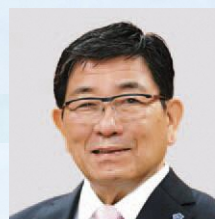
古田 肇 (ふるた はじめ) 岐阜県知事