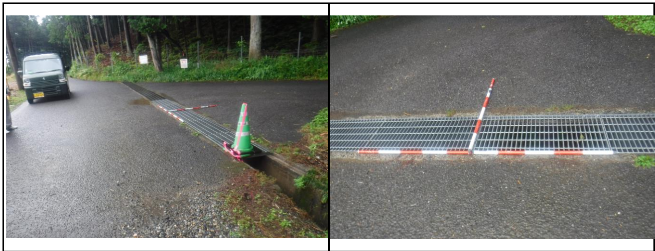
北側から南へ向かって撮影 盗難箇所(側溝の端からグレーチングを2枚移設済)