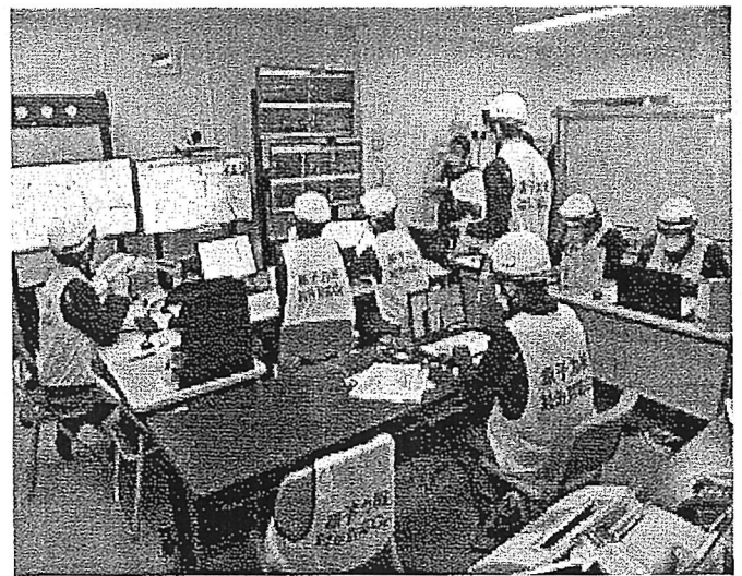
即応センター ERC 対応ブース（原子力本部）