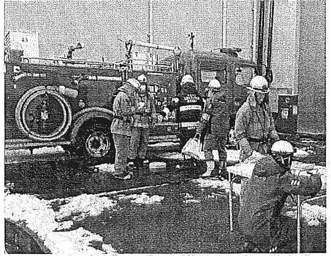
火災対応訓練（発電所）