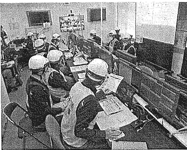
即応センター 本部卓（原子力本部）