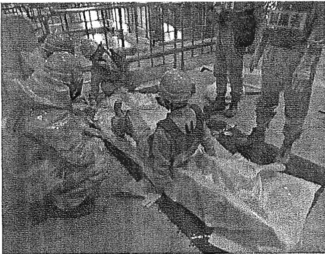
原子力災害医療訓練（発電所）