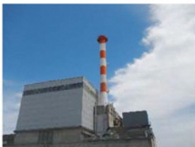
東海発電所 排気筒短尺化工事