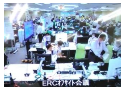
(写真2-3) OFCの図上演習訓練