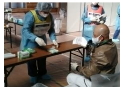
(写真 9-5) 簡易除染(住民)