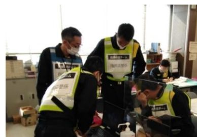
(写真 1-4) 情報収集伝達訓練