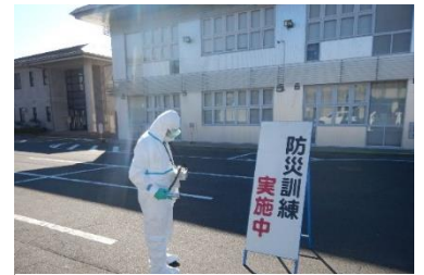
(写真 3-1) 定点モニタリング