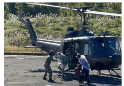
(写真7-2) ヘリによる避難