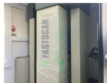
(写真 11-1) ホールボディカウンタの稼働訓練