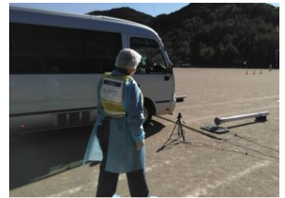
(写真9-1) 車両用ゲート型モニタ