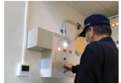
(写真6-2) 陽圧化装置の起動確認