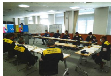
(写真 1-1) 揖斐川町災対本部