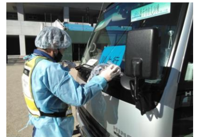
(写真9-2) 放射線測定器による検査(車両)