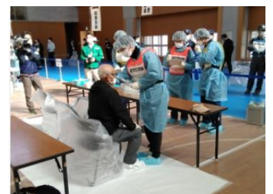
(写真9-3) 避難退域時検査(住民)