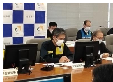
(写真 1-3) 国原子力災害対策本部会議 ※大森副知事の説明 (TV 会議)