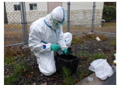
(写真 3-3) 環境試料（土壌）採取