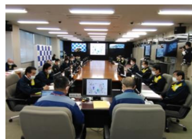
(写真 1-2) 県災対本部(本部員会議)