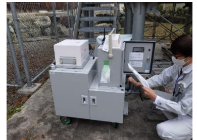
(写真 3-2) 可搬型ポスト設置