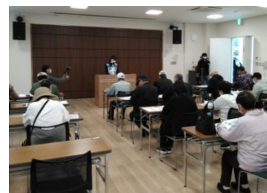
(写真 10-2) 普及啓発講座