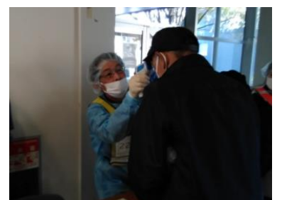
(写真9-4) 受付での検温(住民)