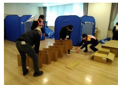
(写真 10-1) 簡易ベッドの組み立て(住民)