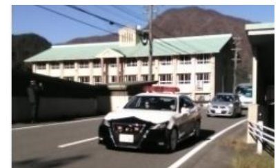
(写真7-1) パトカーによる先導