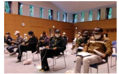
(写真6-1) 住民による屋内退避