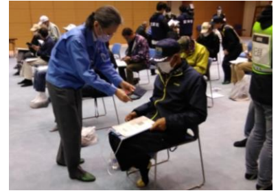
(写真8) データ登録の様子