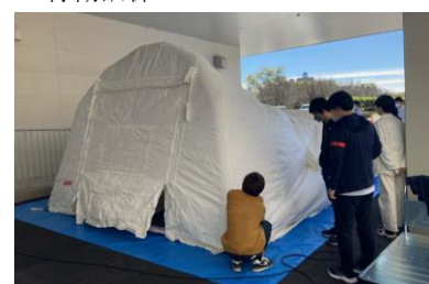
(写真 11-2) テントの設置訓練