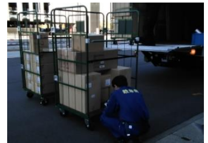
(写真 4) ヨウ素剤受け入れ