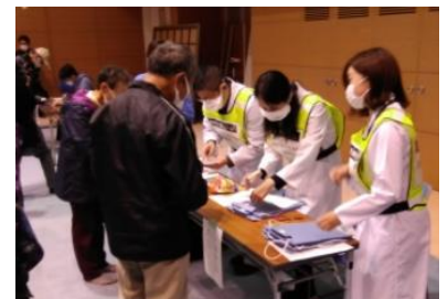
(写真6-3) 安定ヨウ素剤の配布