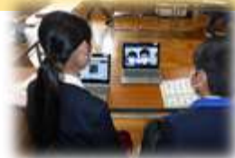
◎垂井町教育委員会 学校教育課

例) 令和4年度は、全小学校が3つのグループに分かれて、オンライン交流を実施する予定である。内容は、自校の誇りの交流、中学校入学に関する質疑応答等である。