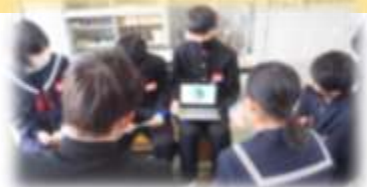
◎垂井町教育委員会 学校教育課