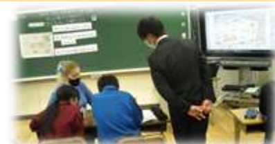
◎垂井町教育委員会 学校教育課

例) 学習活動に応じて、ALTがTIとして全体指導したり、T2としてモデル提示や個別指導したりする。