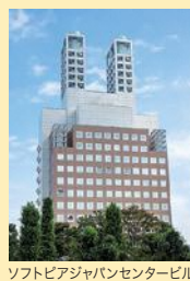
ソフトピアジャパンセンタービル

会場 ソフトピアジャパンセンター (〒503-0006 岐阜県大垣市加賀野 4丁目1番地7)