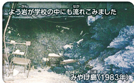
よう岩が学校の中にも流れこみました