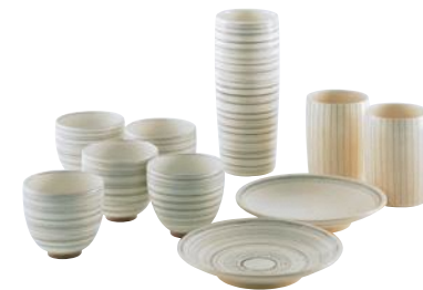
門工房《千点紋食器一式》1962年