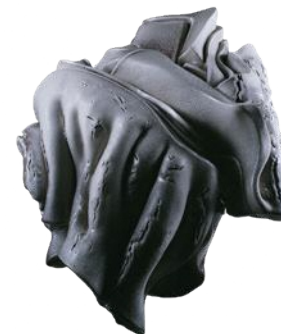
カルロ・ザウリ《白い官能》1976年