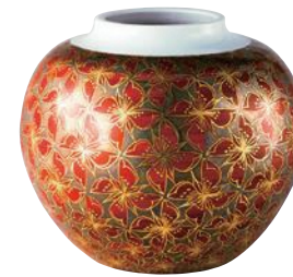
富本憲吉《色絵金銀彩四弁花模様飾壺》1960年