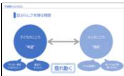
自分を探る時期だから揺れ動く