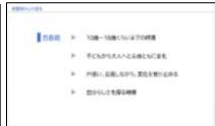
思春期の心の変化