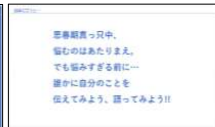
相談すること=SOSを出す