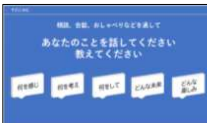
【演習】話すことで悩みを軽くする