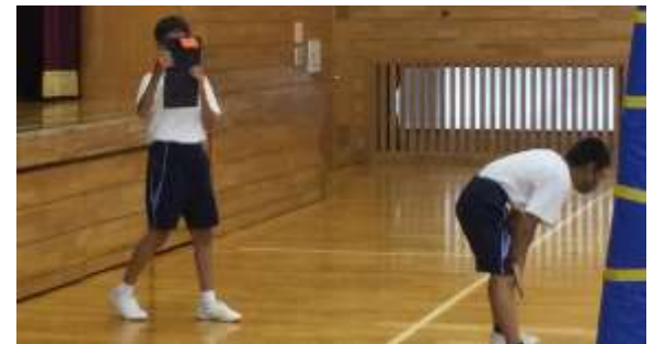
図1, 2 撮影中の様子