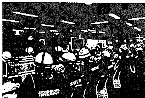
緊急時対策所での対応の様子