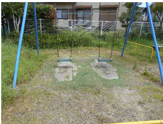
事故発生時のマットの状況