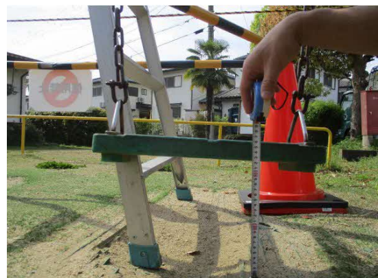
ぶらんこのクリアランス