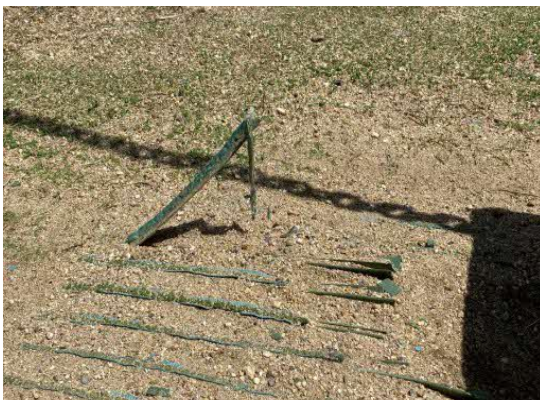
事故発生時のマットの状況