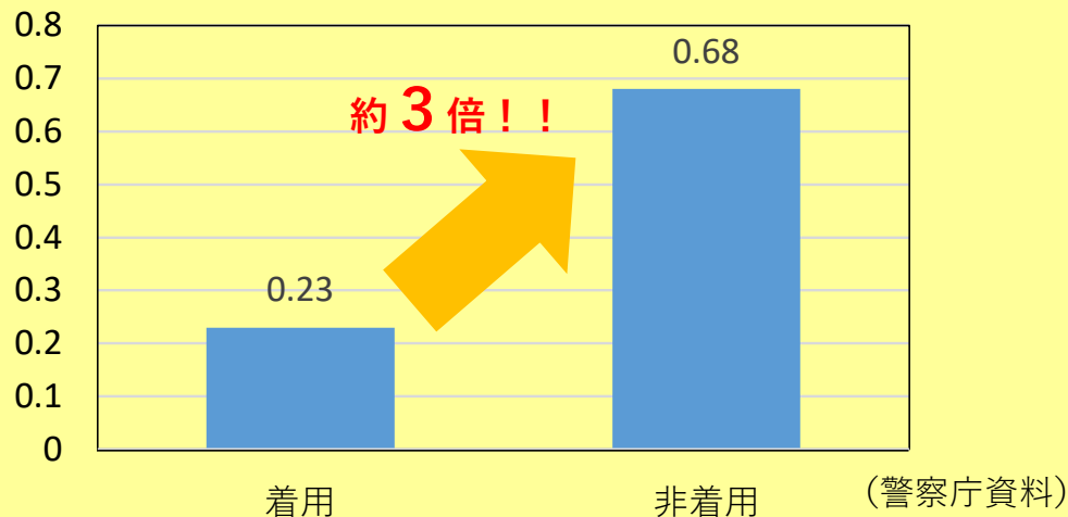
(%) ヘルメット着用状況別の致死率比較（令和2年）