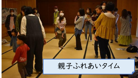
親子ふれあいタイム

日頃、あまり考えない「防災」についてやらせてもらえて、初めての方と話せてあんなこと、こんなことやったらいいかなと思えることがたくさんあった。 決して他人事ではないので、これを機会にリュックの中を見直したり、いざというときにどうしたらいいのか、リストを作って、見えるところに貼っておこうと思った。