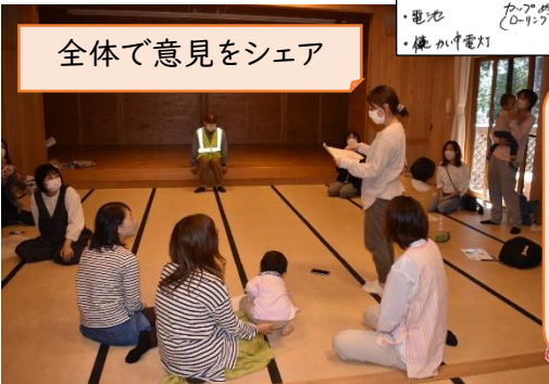
全体で意見をシェア