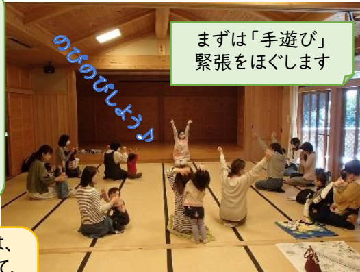
まずは「手遊び」緊張をほぐします