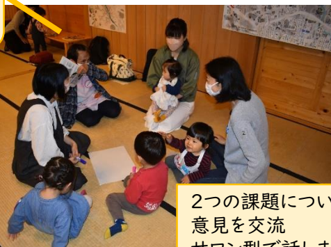
2つの課題について意見を交流 サロン型で話します