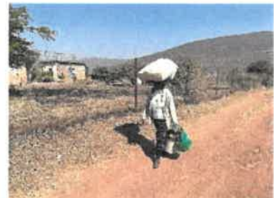
重い荷物を頭にのせて運んでいます。バランス感覚がすばらしい！