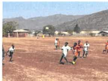
土曜日にグラウンドでサッカーの試合。裸足の子もいて、びっくり。