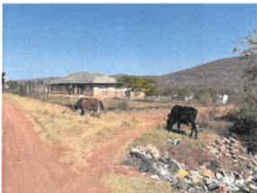
通学路に牛や羊が！フンもたくさん落ちています。ゴミも気になる…。