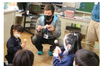
生活科支援(昔の遊び)