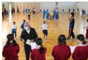
伝統芸能(地域の踊り)