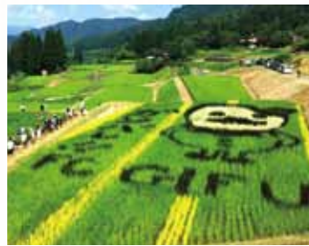
畑ヶ谷棚田(六ノ里・棚田にしているプロジェクト)