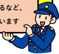
自転車が関係する交通事故の発生状況時間帯 (過去5年間)

警察では、自転車運転者の信号無視等に対し、指導警告を行うとともに、悪質・危険な交通違反に対しては検挙措置を講ずるなど、厳正に対処しています