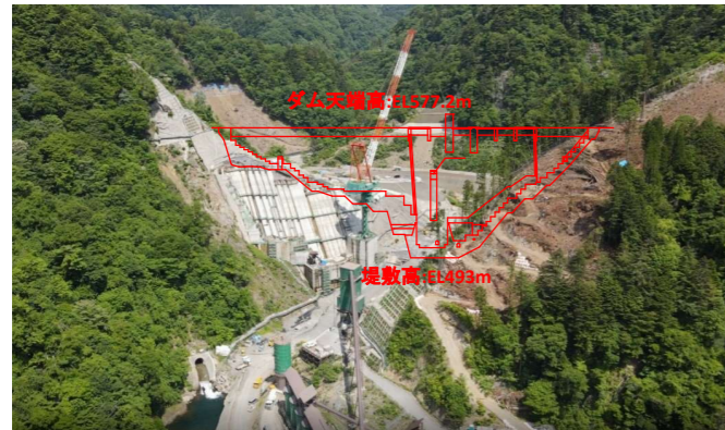
① ダムサイト状況(下流上空より望む)