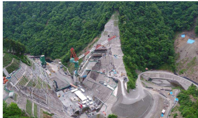
② ダムサイト右岸状況(左岸上空より望む)