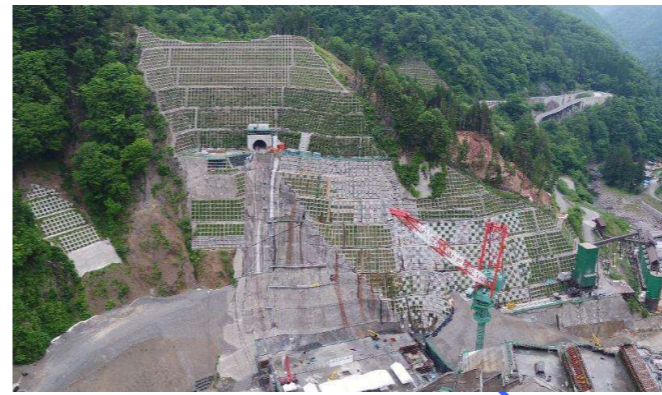
③ ダムサイト左岸状況(右岸上空より望む)