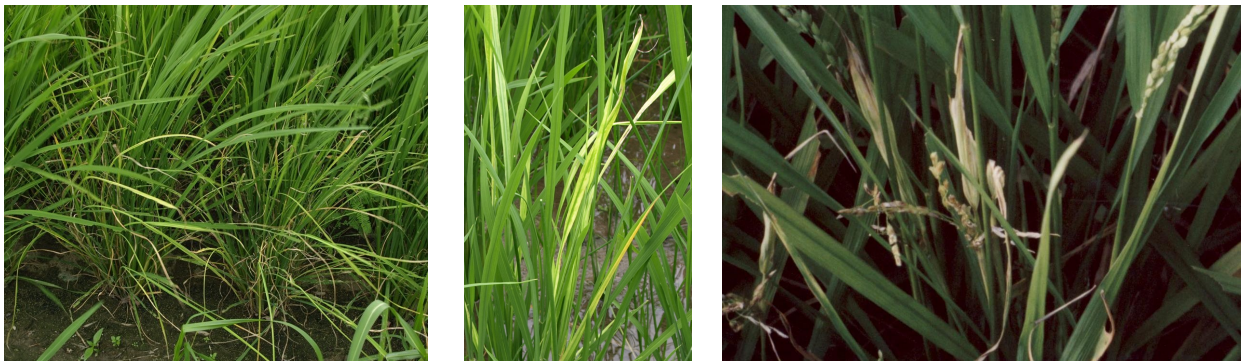
図2 縞葉枯病（左：ゆうれい症状、中：葉の病斑、右：穂の出すくみ）