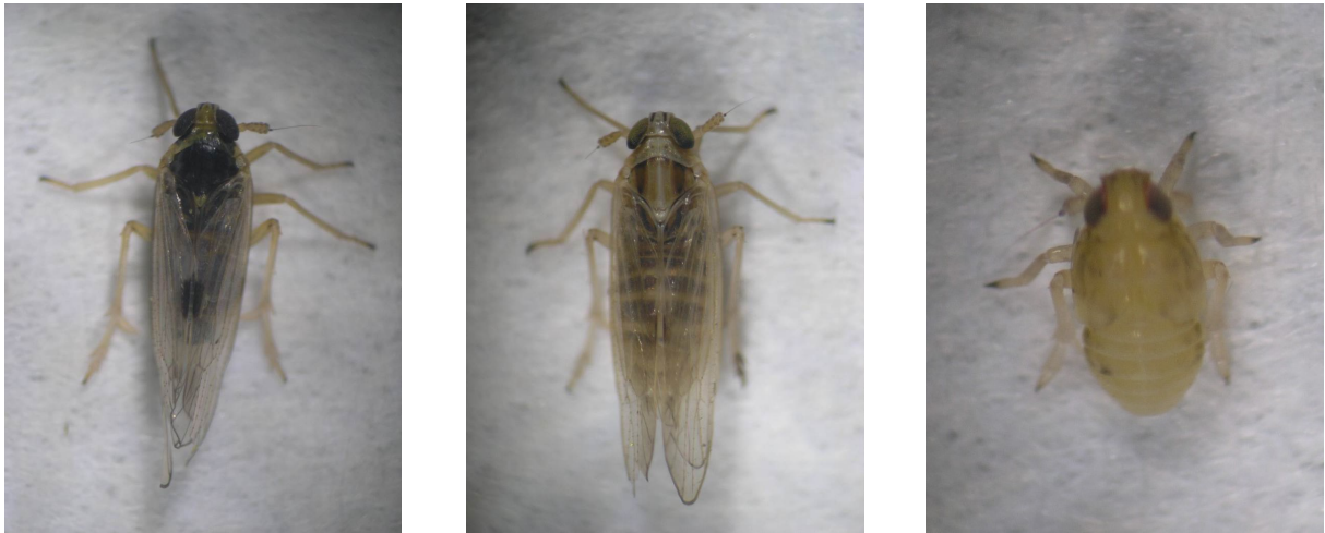
図1 ヒメトビウンカ（左：雄成虫、中：雌成虫、右：幼虫）