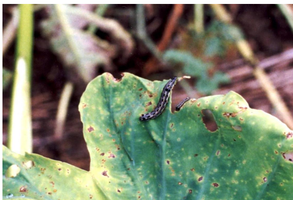
図3 サトイモを食害する老齢幼虫