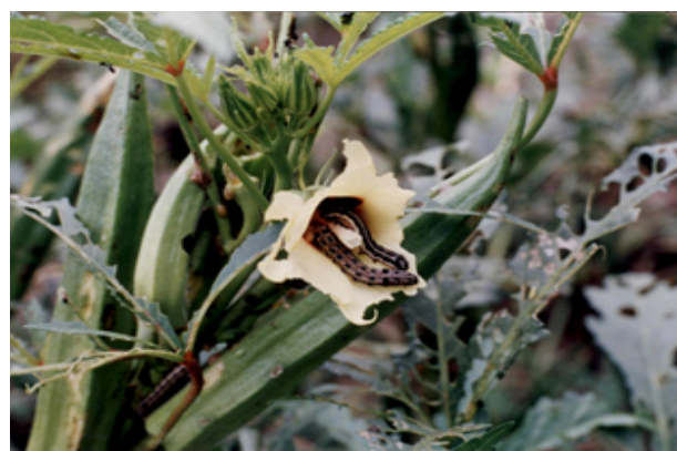
図4 オクラの花を食害する老齢幼虫