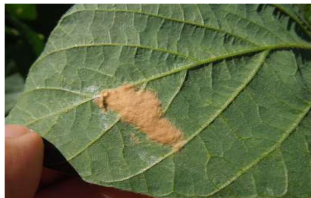
図2 葉に産み付けられた卵塊