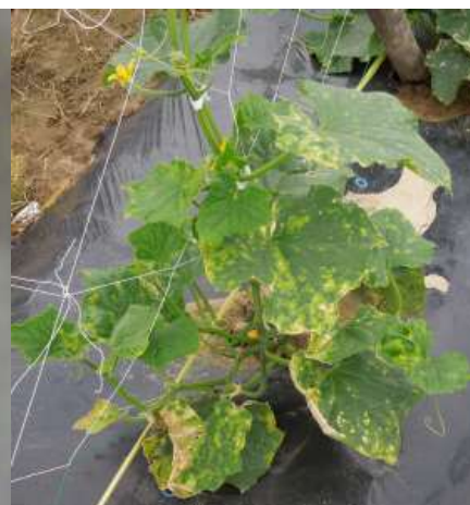
図5 MYSVに感染したキュウリ