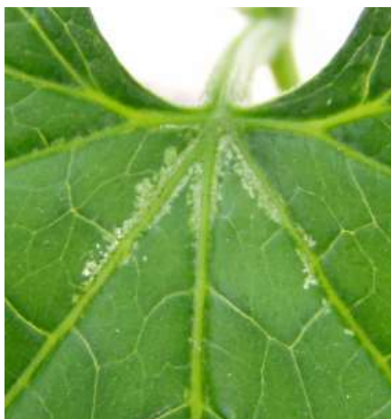
図3 キュウリ葉表の食害痕