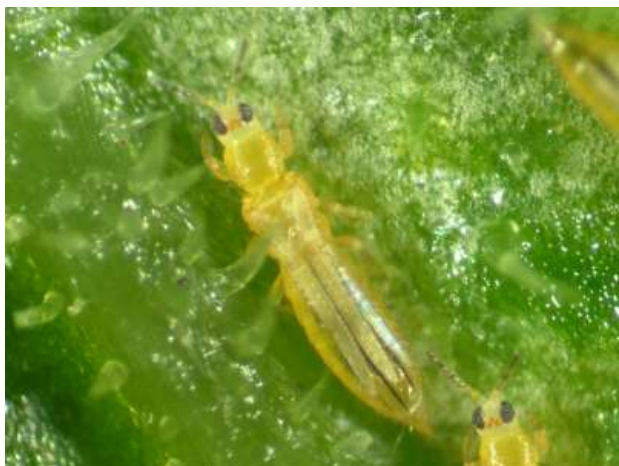
図1 成虫（体長約1.3 mm）