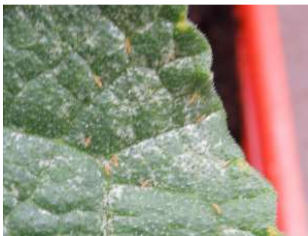
図2 群生するミナミキイロアザミウマ