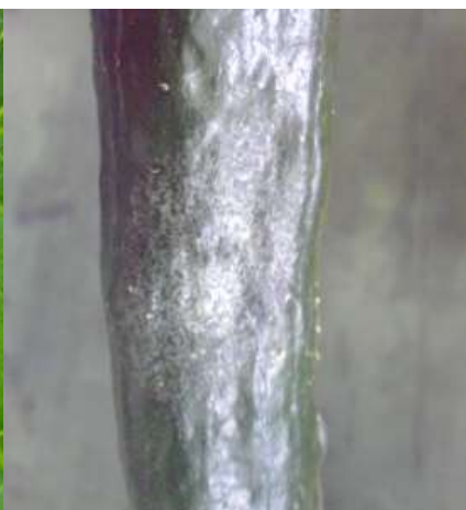
図4 キュウリ果実のシルバリング