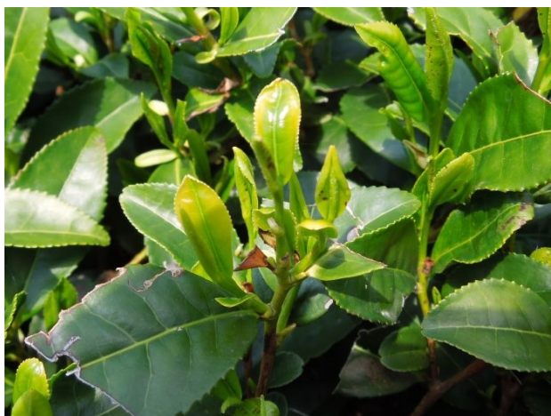
図3 加害された新梢部