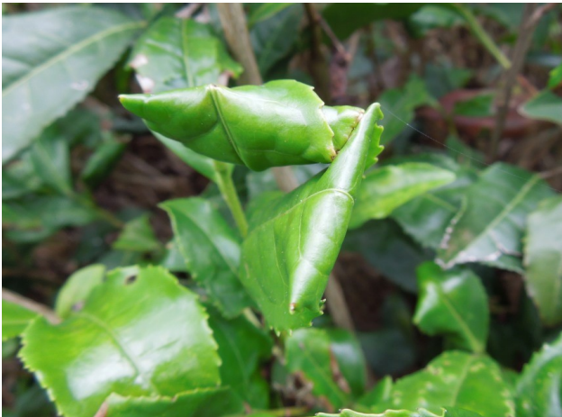
図3 巻葉被害の様子