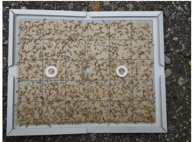
図4 フェロモントラップに誘殺された成虫