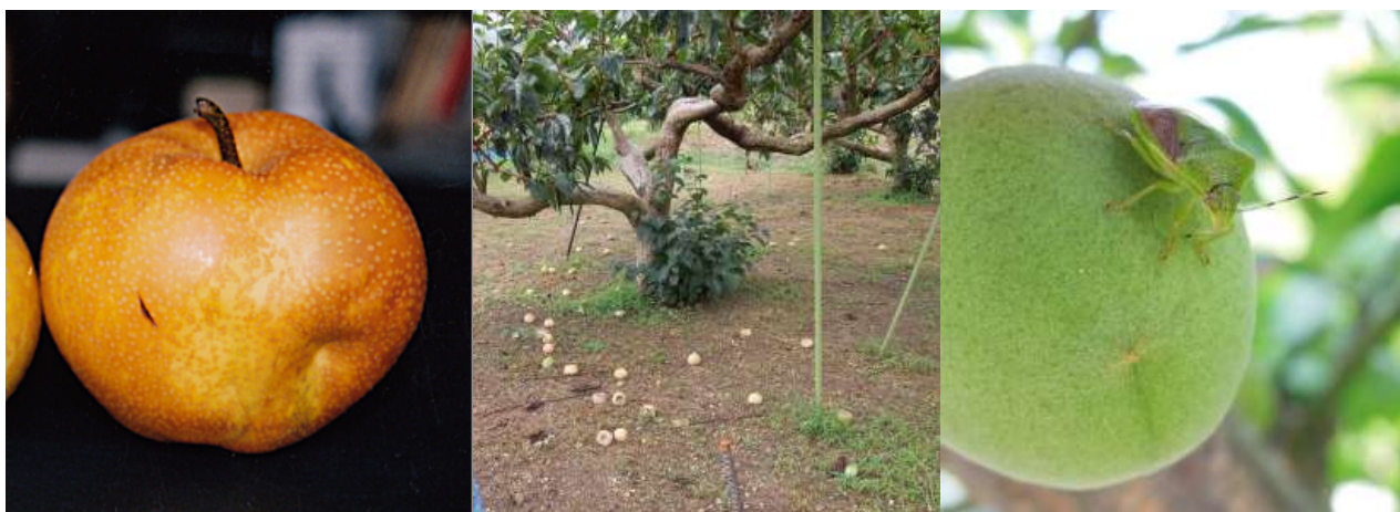
図5 ナシの被害果 図4 落果したカキの幼果 図6 ウメを加害するチャバネ