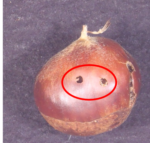
図2 老熟幼虫の脱出孔（赤丸内）