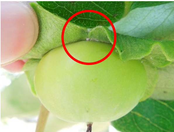
図3 幼果への寄生（○内）