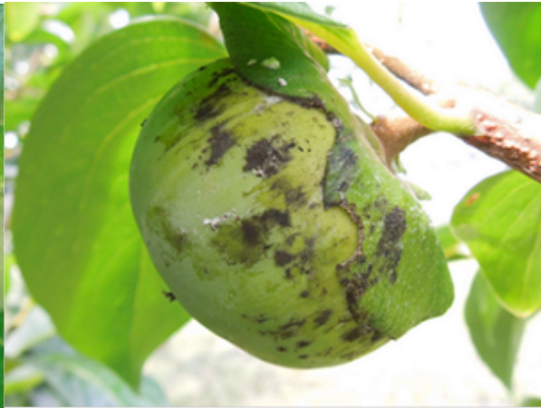
図4 排せつ物に発生したすす病